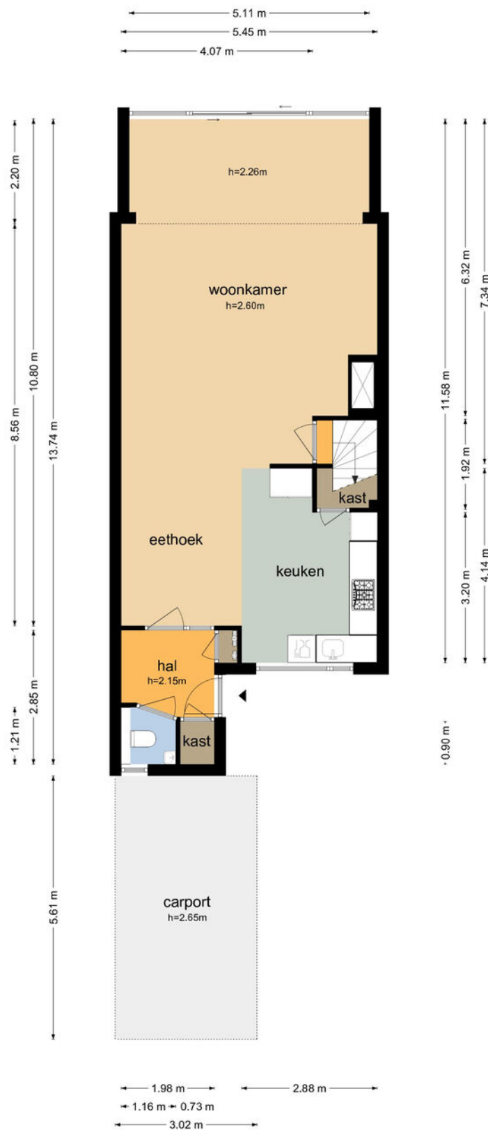
Het Kruiwerk 75 - Hoorn Begane Grond