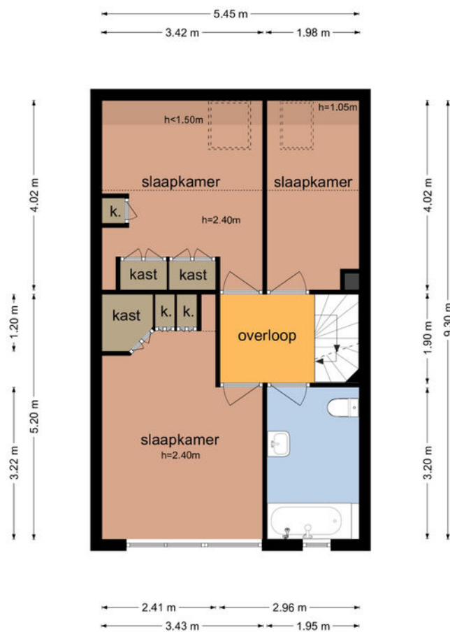
Het Kruiwerk 75 - Hoorn Eerste Verdieping

De plattegronden zijn geproduceerd voor promotionele doeleinden en ter indicatie. Aan de plattegronden kunnen geen rechten worden ontleend